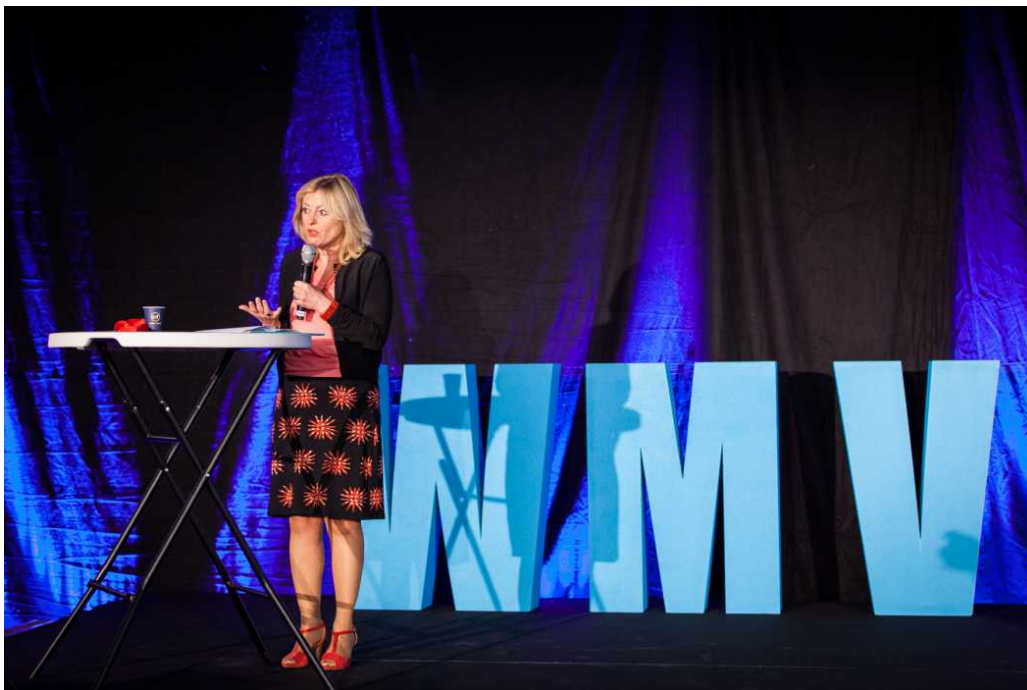
— Minister Bussemaker

ben ik het van harte mee eens. Het Regionaal Investeringsfonds haakt daar op aan. Gemeenten kunnen daarbij de regie nemen. Zo krijgen we meer slagkracht bij de aansluiting tussen onderwijs en arbeidsmarkt.” Over de tweede aanbeveling zegt ze: “Daar is nog een flinke slag te maken. Dat kan echt beter. We zien veel mooie voorbeelden in de praktijk, het stimuleren van jongeren om banen te ontdekken die nu misschien nog niet eens bestaan. Korte stages kunnen daarbij helpen.” Over de derde aanbeveling zegt ze: “Ik ben het met de Raad eens dat het beter kan en beter moet. Er zijn lacunes en onvolkomenheden in het huidige beleid. We moeten bijvoorbeeld meer doen voor kwetsbare groepen op de arbeidsmarkt. De scholingsaftrek die we nu hebben is niet echt effectief, met een nieuwe regeling met ‘vouchers’ kunnen we wellicht meer effect bereiken. Dat gaan we uitwerken, en daarbij voel ik me gesterkt door de Onderwijsraad.” Bussemaker rondt af: “Kortom, in hoofdlijnen zijn we het eens, nu moeten we ook concreet aan de slag. Naar een betere aansluiting, en naar het terugdringen van ongelijkheid in het onderwijs. Ik ga aan de slag en ik hoop dat wat hier in de regio wordt ontwikkeld een voorbeeld voor het hele onderwijsveld kan zijn. Ik wens jullie een inspirerende middag!”